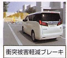
衝突被害軽減ブレーキ