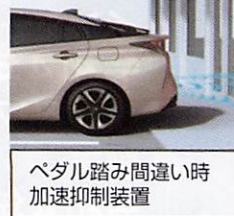
ペダル踏み間違い時加速抑制装置