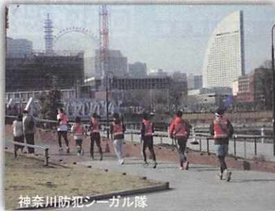
神奈川防犯シーガル隊