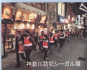
神奈川県防犯シーガル隊

問合せ先 神奈川県自転車商協同組合 TEL045-311-6168 http://www.kanasho.jp