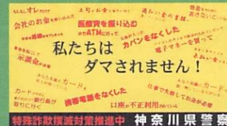
特殊詐欺撲滅 キャンペーン