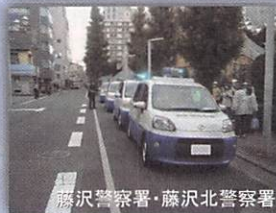
藤沢警察署・藤沢北警察署