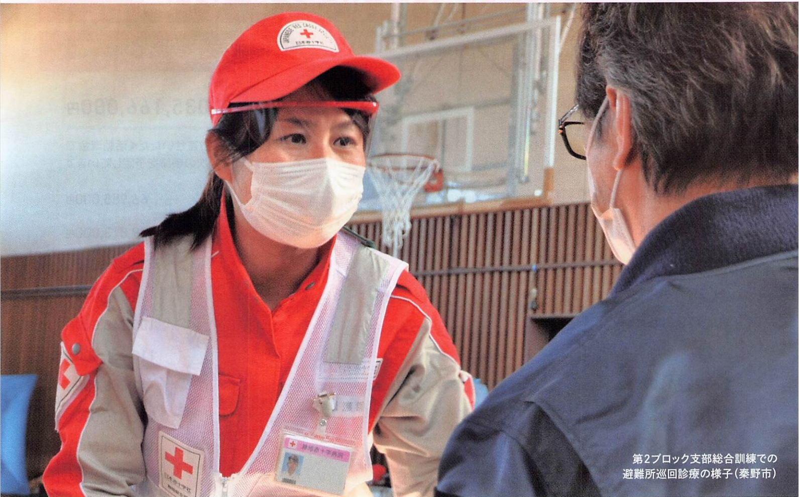
第2ブロック支部総合訓練での 避難所巡回診療の様子(秦野市)