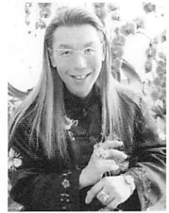
假屋崎 省吾 氏(元祖華道家)

東京・銀座【假屋崎省吾 花教室】主宰。「美をつむぎだす手を持つ人」と評され、各国首脳来日歓迎や天皇在位10年記念、天皇退位・即位など多数の花制作を手掛ける。女子美術大学・客員教授、フランス観光親善大使、オランダチューリップ大使などを務め、花と建物のコラボ個展“歴史的建築物に挑む”を国内外で開催。「花育活動」や「少子化問題」などの社会活動も積極的に取り組み、今年、華道歴40周年を迎え、益々活躍の場を広げている。