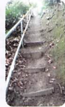
たぶのき公園裏山 津波避難路その2