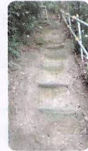
たぶのき公園裏山 津波避難路その1