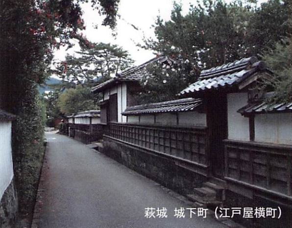
萩城 城下町 (江戸屋横町)